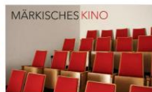
Märkisches Kino (pausiert 2...