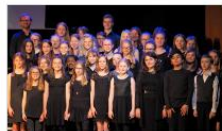
Chor der Sekundarstufe 1