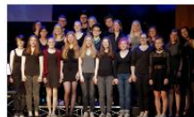
Chor der Sekundarstufe 2