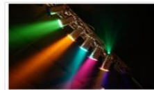
Bühnen- und Veranstaltungs...