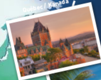
Québec / Kanada