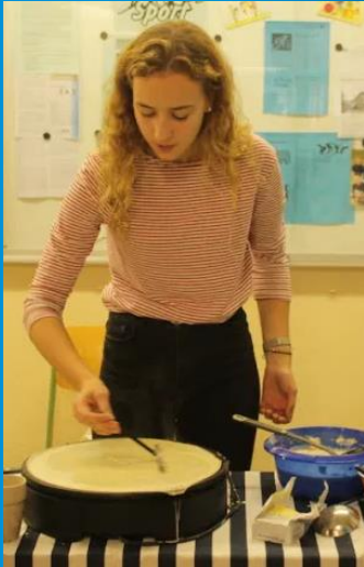
schmackhaft 😊 (Crêpes-Verkauf am Tag der offenen Tür)