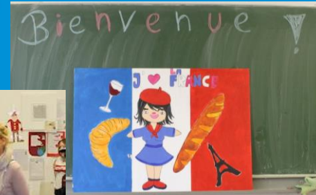
kreativ (Theaterstück am Tag der offenen Tür)